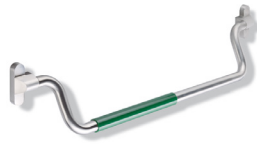
Panikstange System 111