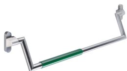
Panikstange System 162